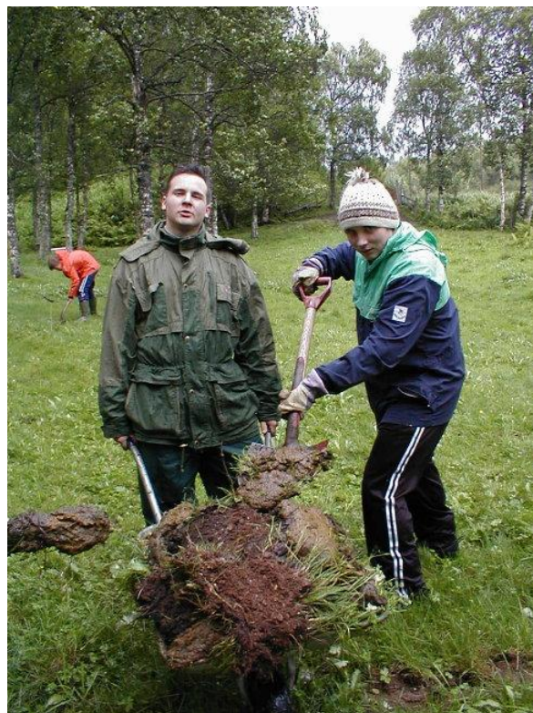
Dugnadsbilde fra da Márkomeannu ble arrangert på Dyrskueplassen i 1999 og 2001.

Første gang Márkomeannu ble arrangert var i 1999, med ca 200 festivaldeltakere, andre gang var i 2001, med ca 300 deltakere. Begge gangene ble festivalen avholdt på Dyrskueplassen i nærheten av Harstad, Narvik, Evenes lufthavn. I 2002 ble festivalen flyttet hjem til de markasamiske bygdene, med hovedfestivalsted på Gállogieddi museum. Festivalen ble meget vellykket, og nesten doblet sitt besøkstall med en deltagermasse på oppunder 600 mennesker. Festivalaktiviteten økte også betraktelig. Festivalen ble arrangert over to dager, og dro inn flere artister og kulturelle innslag. Fram til 2004 ble festivalen arrangert med samme programstruktur, og tilskuertallet økte gradvis fra år til år. I 2004 var det 1200 besøkende på Márkomeannu i løpet av tre dager. I 2005 ble imidlertid programmet utvidet til en hel uke, og dro til seg et samlet tilskuertall på 2400.